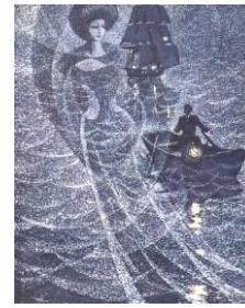
Алые паруса Блистающий мир Капитан Дюк Крысолов Бегущая по волнам